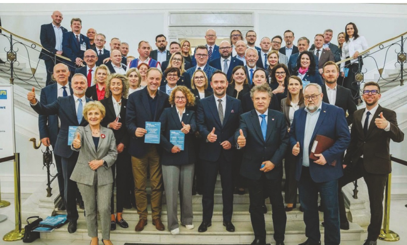
Pomorscy samorządowcy w Sejmie – 28.04.2026 r.