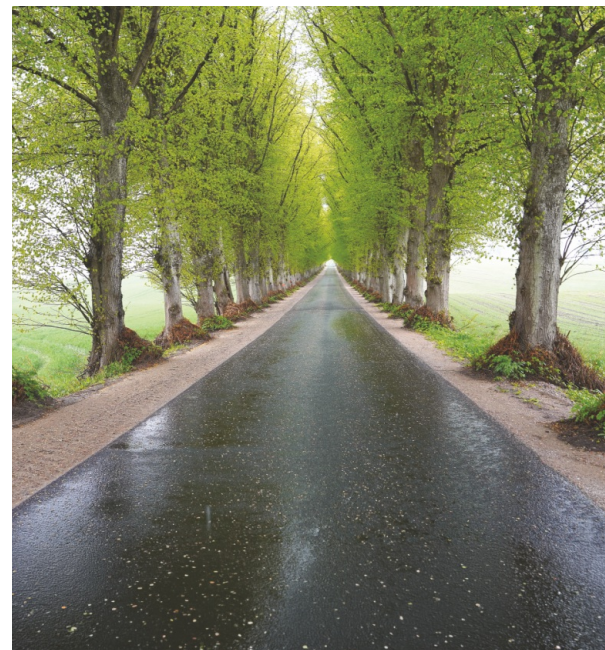
Wyremontowana droga powiatowa Dzieścielec - Nawcz

Zakres robót objął kompleksową modernizację nawierzchni. Istniejąca jezdnia została poddana frezowaniu korekcyjnemu, po którym ułożono warstwę wyrównawczą z betonu asfaltowego. Dodatkowo zastosowano siatkę przeciwspekaniową oraz warstwę ściernalną z mastyksu grysowego, co zwiększy trwałość drogi i komfort jazdy. Wykonana została także regulacja zjazdów oraz uporządkowanie zieleni, a także wycinka krzewów i samosiejek. Wartość zadania to blisko 1,1 mln zł.